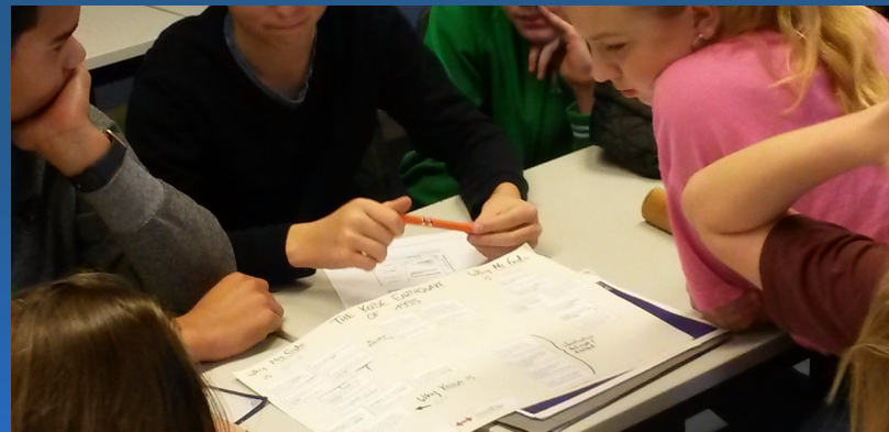
History – Teamwork