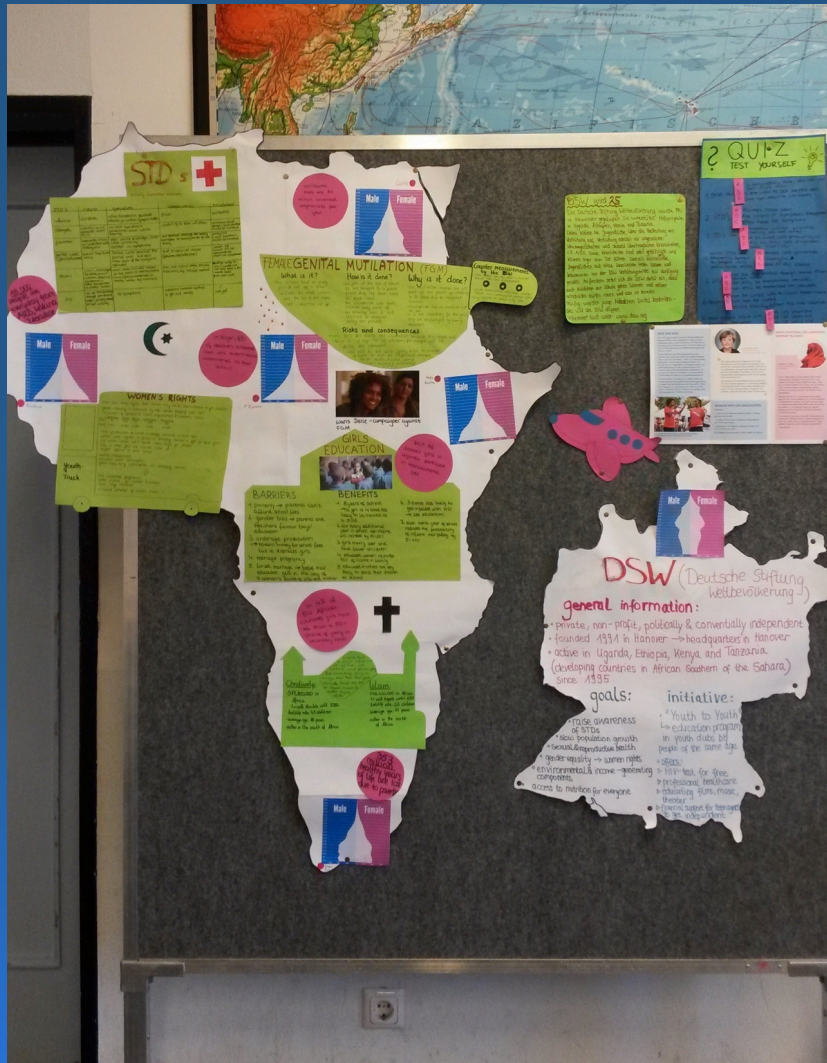
Geography – Presentations