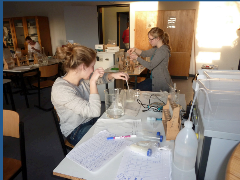
Biology – Experiments